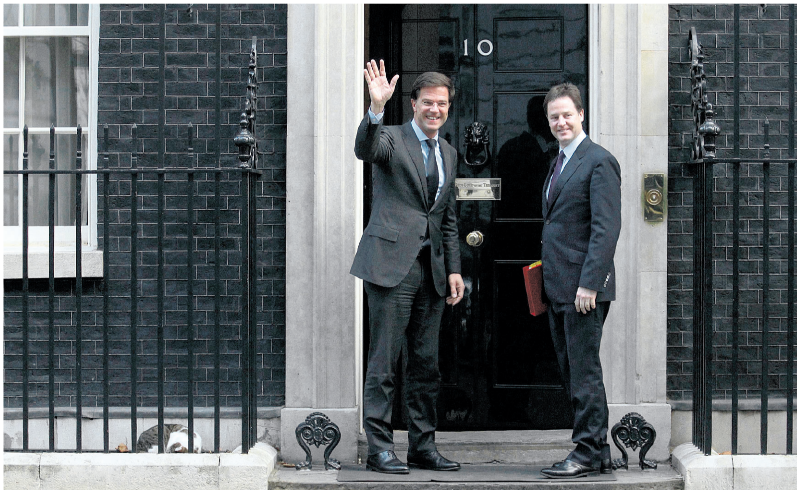
Premier Rutte en vicepremier Clegg op de stoep van de ambtswoning van de Britse premier in Londen.